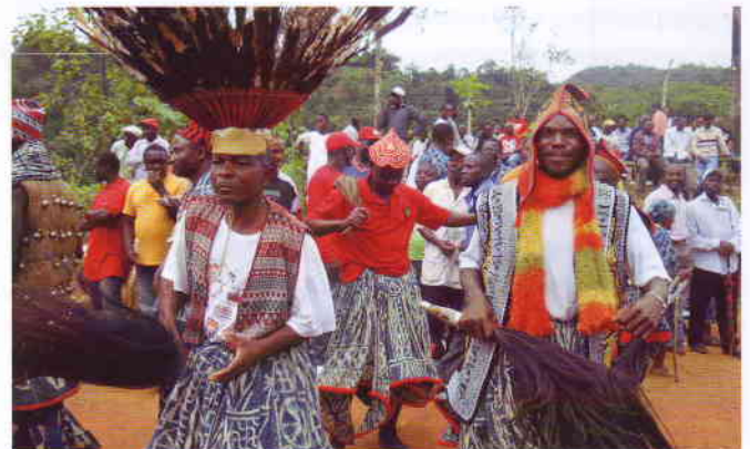
Nicht für Touristen herausgeputzt; Traditionen werden noch hochgehalten.