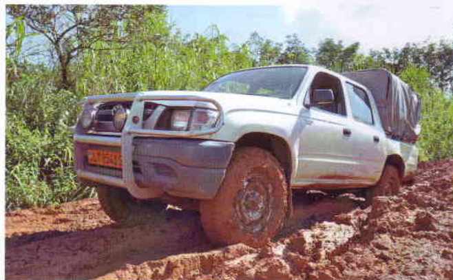
Unser voll beladener Jeep führt uns und das Material pannenfrei durch den tropischen Wald.

Mit dem Visum in der Tasche, vollem Impfbuch und 40 Kilo Material in meinem (Über)Gepäck fliege ich am 15. September 2009 von Zürich aus ins feuchte Klima von Douala, der grössten Stadt Kameruns. Die restlichen 140 Kilos warten bereits auf mich am Flughafen. Das Verzollen beansprucht drei halbe Tage Verhandlungen. Endlich können wir alles in den Jeep aufladen, und los geht's Richtung Wald, 10 Stunden lang. Die 540 km „Strasse“ sind schon an und für sich filmreif. Ich geniesse sie wie ein Erlebnis und zudem... kostenlos.